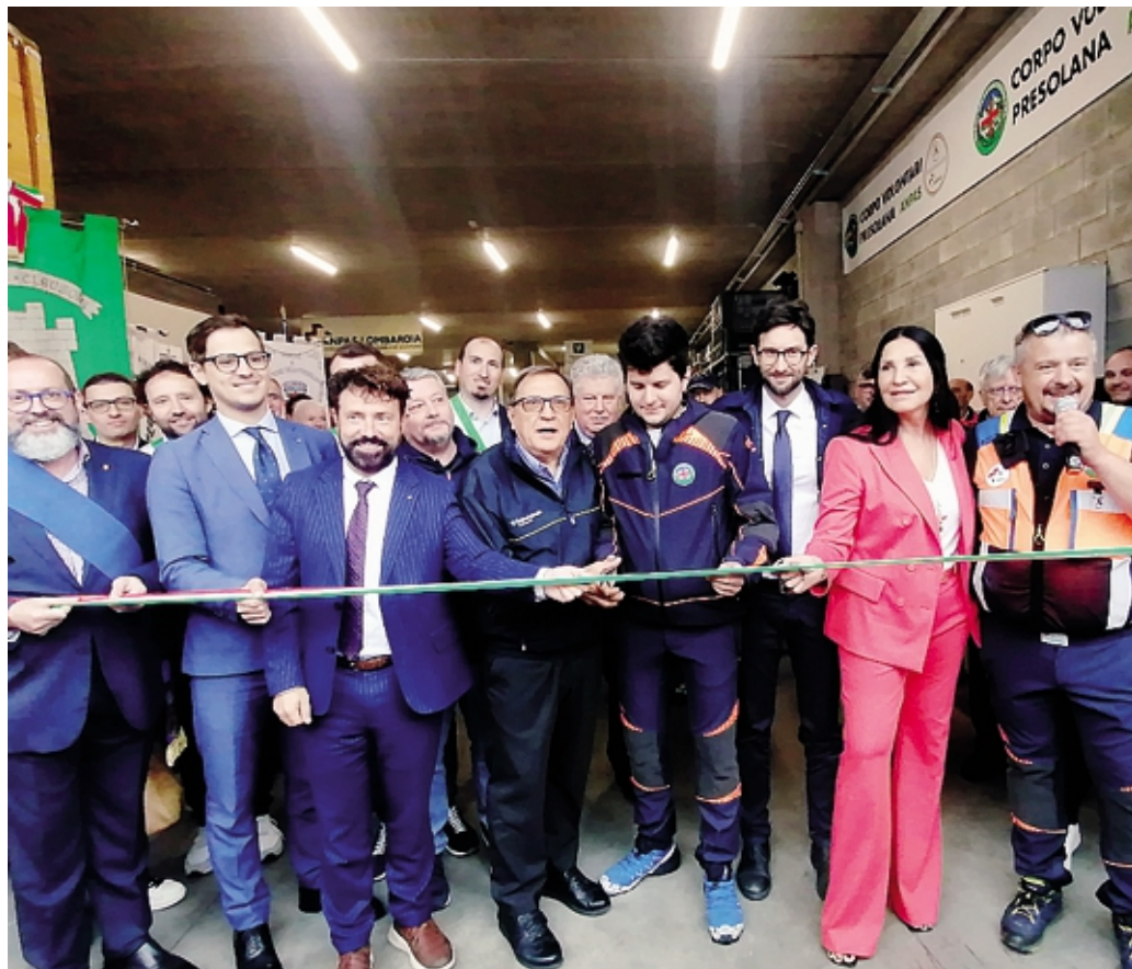
Il taglio del nastro con le autorità

L'assessore regionale alla Protezione civile, Romano La Russa, ringraziando tutti i volontari ha detto: «Siamo orgogliosi. L'inaugurazione di un sito come questo per la protezione civile è un punto fondamentale, un esempio e un'eccellenza per la Lombardia e per l'Italia». L'assessore alla Casa e Housing sociale Paolo Franco ha aggiunto che «un polo logistico di que-