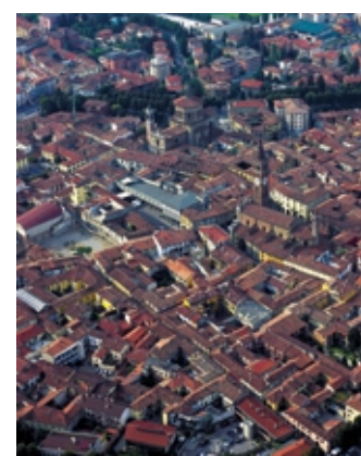
Si partirà da Treviglio

E la «Tre'n bici vintage», iniziativa che partendo da Treviglio si svilupperà per 70 chilometri, attraversando la pianura con direzione i Colli di Bergamo e Città Alta, per poi concludersi nel capoluogo della Bassa. L'evento, alla seconda edizione, è organizzato da Aribi (Associazione per il rilancio della bicicletta), in collaborazione con Team Gerobike e Legambiente Terre del Gerundo. Il percorso è un anello che unisce Treviglio a Bergamo e ha anche valenza naturalistica attraversando i parchi del Brembo, dei Colli di Bergamo e del Serio. Durante il tragitto ci sarà una sosta con ristoro