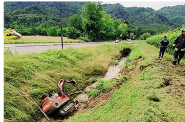
La piccola ruspa cingolata finita nel fosso accanto al campo